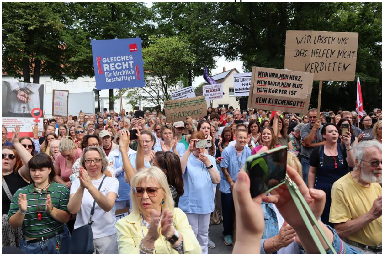
Lippstadt am Freitag, 8. August 2025: Momentaufnahme von der Demonstration für Frauenrechte.