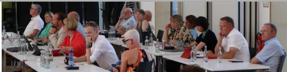
Lippstadt am Montag, 30. Juni 2025 (II): Blick während der damaligen Ratssitzung auf die SPD-Fraktion im Rat der Stadt Lippstadt in der Gesamtschule an der Ulmenstraße, die nach der Kommunalwahl in 2020 mit den Überhangmandaten aus acht Frauen und acht Männer besteht.